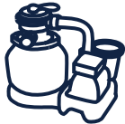
Groupe de filtration INTEX 6m 3 /h